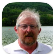
Hervé BLAISE Centre