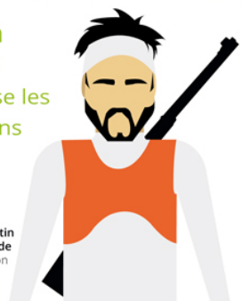
Martin Fourcade Biathlon

En randonnée, j'utilise les sentiers et les chemins et je rapporte mes déchets.