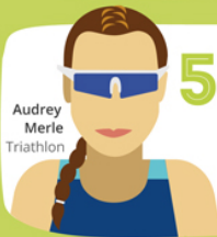
Audrey Merle Triathlon