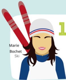
Marie Bochet Ski