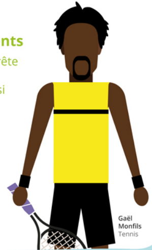
Gaël Monfils Tennis