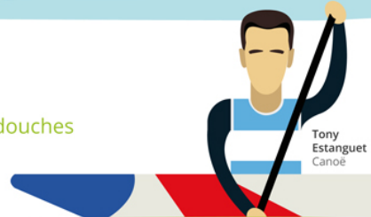
Tony Estanguet Canoe

Je fais attention à ma consommation d'eau lors des douches ou pour nettoyer le matériel, j'éteins les lumières.