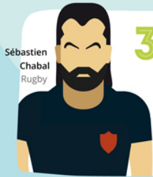
Sébastien Chabal Rugby