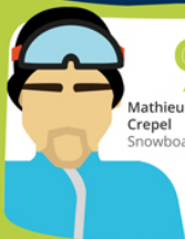
Mathieu Crepel Snowboard