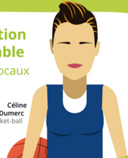
Céline Dumerc Basket-ball

J'achète des produits locaux et de saison et j'évite le gaspillage.