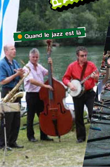
● Quand le jazz est là