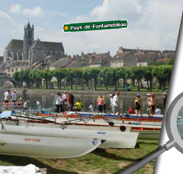
● Pays de Fontainebleau

Association Nautique de Fontainebleau Avon 1 bis, quai «Les Plâtreries» 77920 SAMOIS SUR SEINE