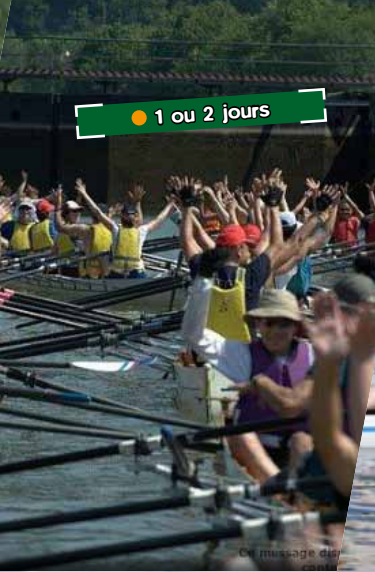
● 1 ou 2 jours