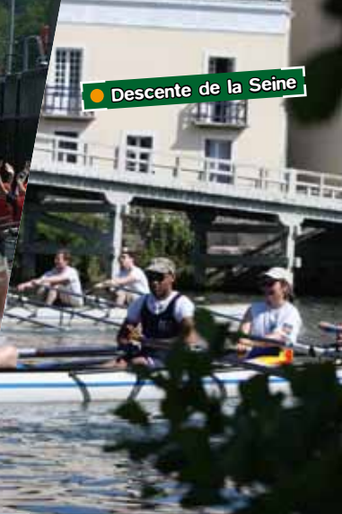
● Descente de la Seine